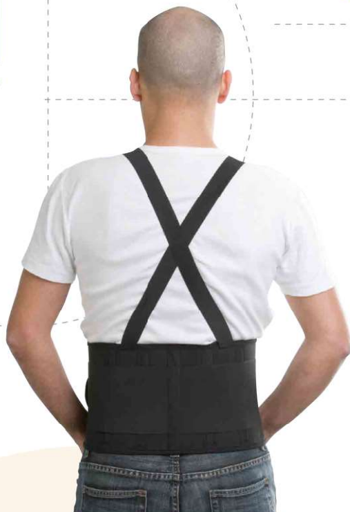
Cinta lombar - com suspensórios