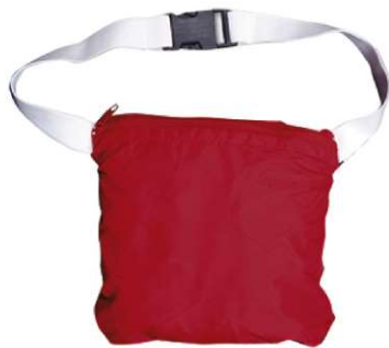
Detalhe: casaco recolhido