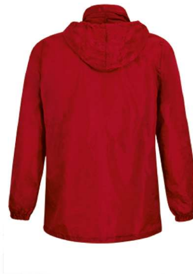
Vista parte traseira da peça (costas)